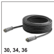
30, 34, 36